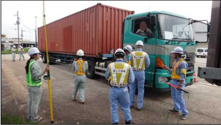
国道17号 塩沢道路ステーションの取締り状況