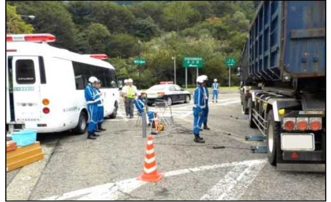
関越自動車道 土樽パーキングエリア(上り線) の取締り状況