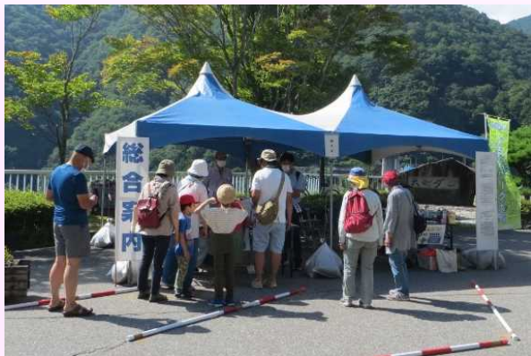
高瀬溪谷フェスティバル

7月は高瀬溪谷フェスティバル、10月は高瀬溪谷秋の3ダムめぐりを開催しました。高瀬溪谷フェスティバルは規模を縮小してではありますが、3年ぶりの対面開催となりました。