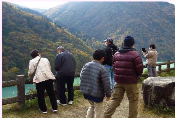
高瀬溪谷秋の3ダムめぐり