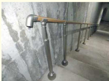
階段手摺設置状況