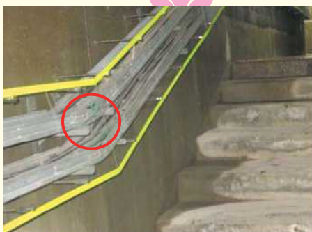
アクリル板設置状況

また、快適にご利用していただくための工夫として、水が溜まりやすい箇所にプールなどで使用するマットを設置しました。