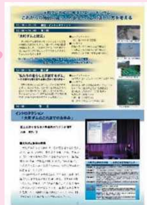
完成30周年記念シンポジウム記録概要