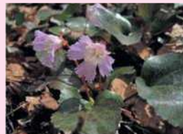
ホンシャクナゲ(4~6月) トクワカソウ(4~5月)