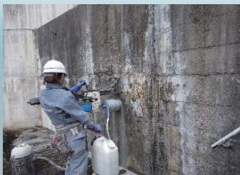
コンクリートコアの採取