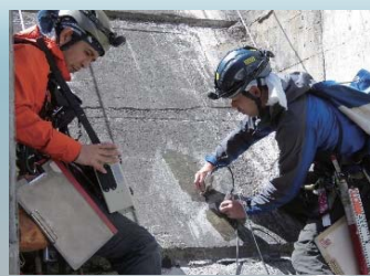
超音波によるひび割れの計測