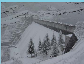
雪化粧した大町ダム

大町ダムホームページのライブカメラや写真ギャラリー「今週の大町ダム」でも大町ダム周辺の写真や様子をお届けしていますので是非今一度ご覧ください。大町ダムHP： http://www.hrr.milt.go.jp/omachi/