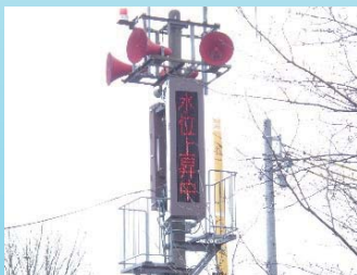
小型情報表示板 （東松川警報所）