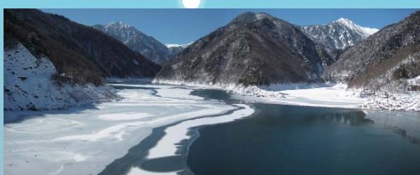
結氷したダム湖と北アルプス