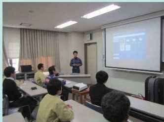
救命処置訓練（机上講義）

今回の訓練をとおり実際に起こってしまった際も、迅速な対応をできるように努めていきたいと思えます。