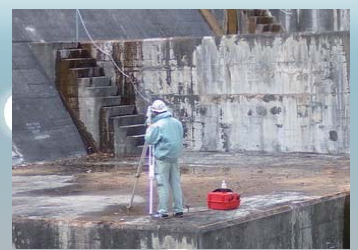
トータルステーションによるひび割れ確認