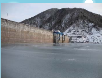
全結氷したダム湖