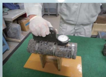
採取したコアの試験