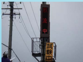
小型情報表示板 （北村警報所）

これらの情報伝達設備のうち、北村警報所と東松川警報所の小型情報表示板について、設置から14年が経過し老朽化していることから11月末から12月にかけて新しくしました。