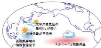
エルニーニョ現象の夏季の天候への影響

《エルニーニョ現象とは》 太平洋赤道域の日付変更線付近から南米ペルー沿岸にかけて、海面水温が平年より高くなり、その状態が1年程続く現象です。