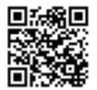
QRコード (カメラ画像提供サイト)

大雨が降った際など、河川やダムの状況を画像で確認して頂けるよう、携帯電話向けにカメラ画像の提供サイトを開設しています。 大町ダムのカメラ画像も配信中です。 ※携帯電話で右のQRコードを読み取り、カメラ画像の提供サイトにアクセスして下さい。