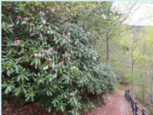
《管理用巡視路のシャクナゲ》 約2.5haの土地にシャクナゲが群生!

・高瀬渓谷では、毎年5月の第1週目あたりから1週間程度、ホンシャクナゲが開花の時期を迎えます。 今年は例年にもまして、たくさんの開花が見られ、近くで温泉旅館を営まれている方のお話では、約10年ぶりの当たり年ではないかとのことでした。 大町ダムの管理用巡視路沿いには、野生のホンシャクナゲが群生しているポイントがあり、その開花状況が新聞で紹介されたこともあって、連休明け以降も多くの方々に訪れて頂きました。