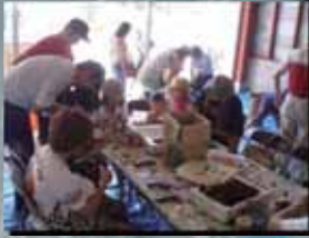
木工品りにチャレンジ!