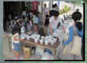
フラワーポットがもらえるよ(^^)!