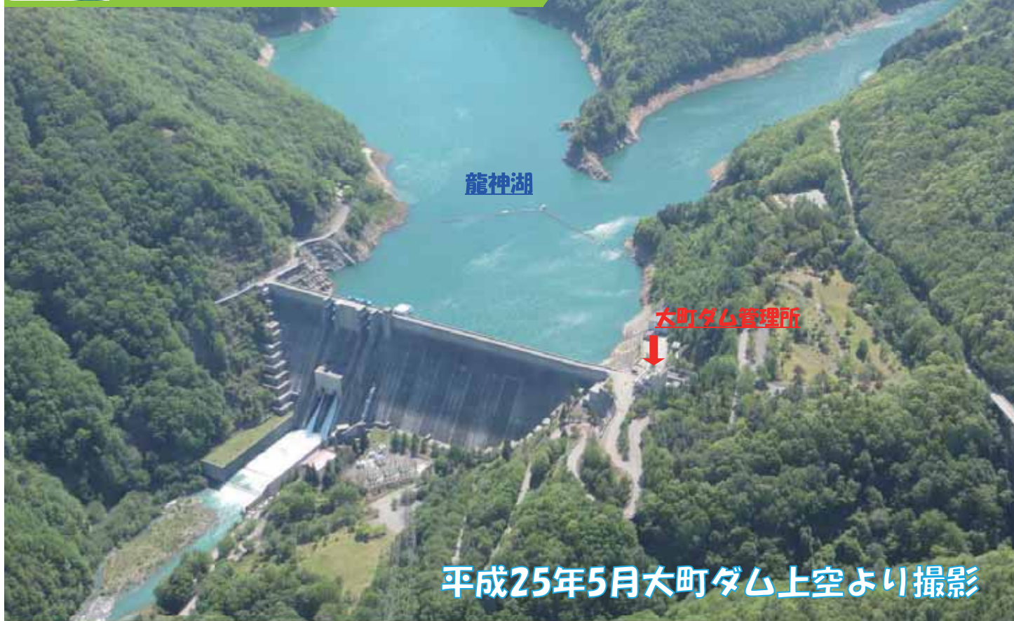
平成25年5月大町ダム上空より撮影