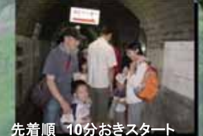
先着順 10分おきスタート 1回あたり30分かかります