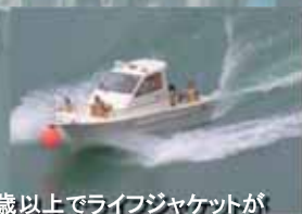
*3歳以上でライフジャケットが 着られる方が乗船できます

9:10 → 12:00 13:00 → 15:00 先着順、20分おきスタート 1回あたり20分かかります