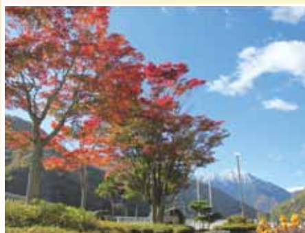
ダム管理所前のモミジ