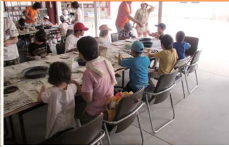
サンドアート・石器ペンダント作り