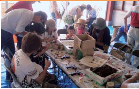
木工品作り・丸太切り体験