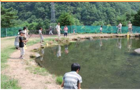
親子テンカラ釣り体験