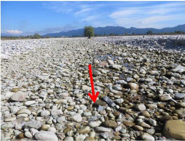
瀬切れ発生 10月2日(水)9:00