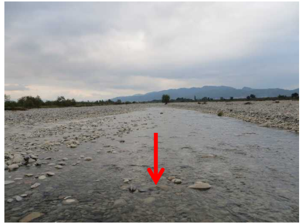
追加放流後の状況 10月2日(水)16:00