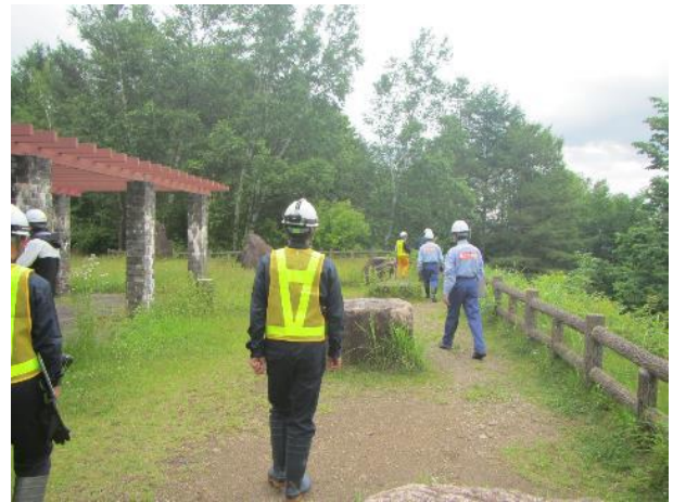
令和7年度夏休み前安全利用点検状況