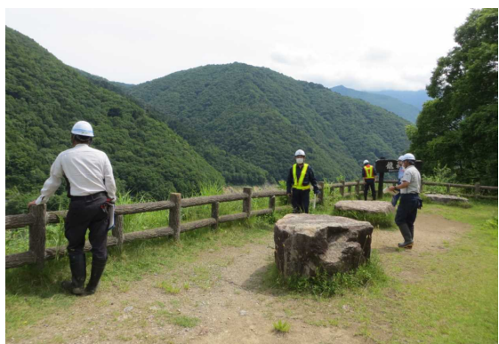
龍神湖展望広場 点検