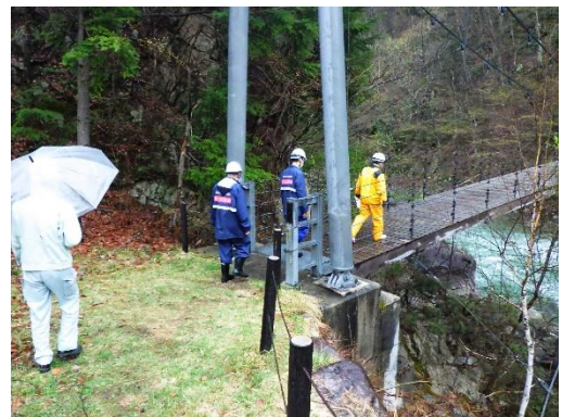
前回の安全利用点検状況(GW前 R4. 4. 14 実施)