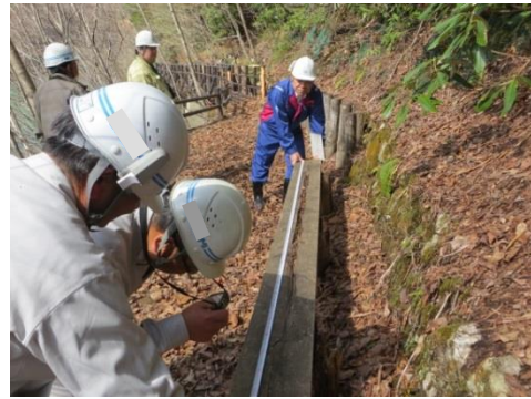
ダム右岸管理用巡視路