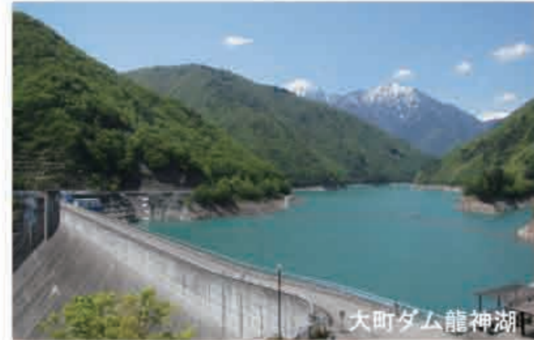
アクセス: 信濃大町駅よりタクシーで(約20分)