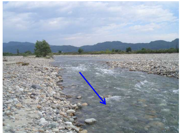
現在の状況 8月30日(金)12:00