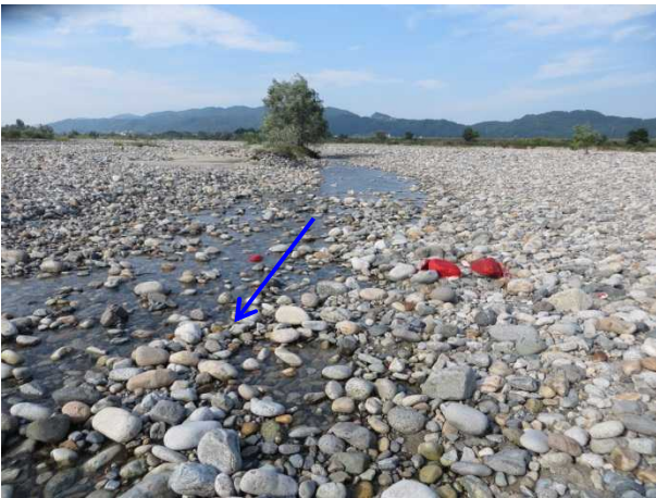
瀬切れ発生 8月29日(木)16:00