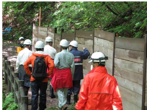
前回の安全利用点検状況(夏休み前 R4. 6. 22 実施)