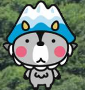
大町市キャラクター おおまびょん

当日は大町エネルギー博物館から、薪バスもくちゃんの運行を予定しております。 (午前・午後 各1回)