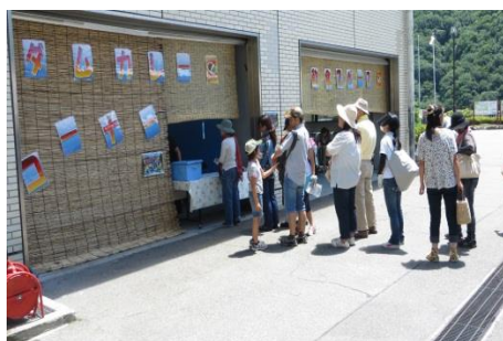
ダムカレーコーナー