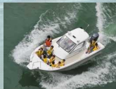
1回あたり約10分かかります