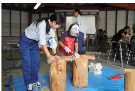
丸太切り体験・木工品作り