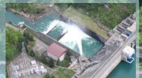
1回あたり約30分かかります