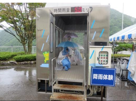
降雨体験コーナー