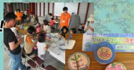
サンドアートづくり