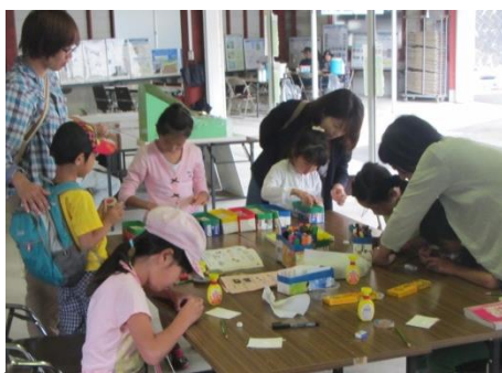
サンドアート作り