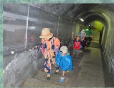
1回あたり約30分かかります