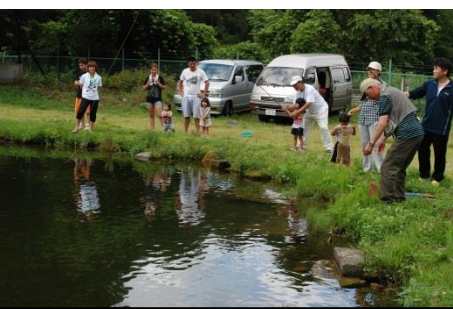
親子テンカラ釣り体験