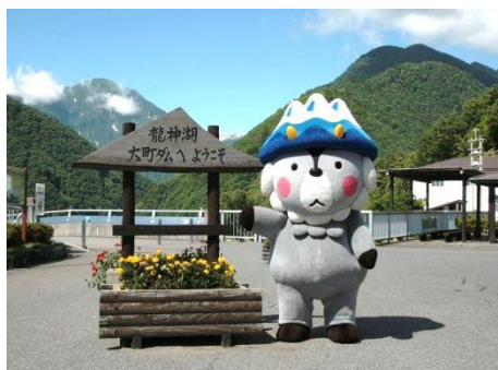
おおまびょん登場！