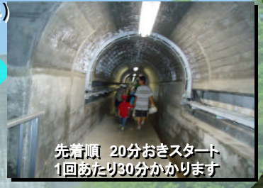
先着順 20分おきスタート 1回あたり30分かかります