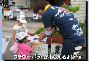
フラワーボットがもらえるよ!!