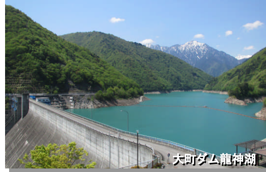
アクセス: 信濃大町駅よりタクシーで約20分

一般車用の第1、2、3駐車場と、大町ダム管理所構内に身障者用駐車場があります。当日は誘導員の指示に従って下さい。