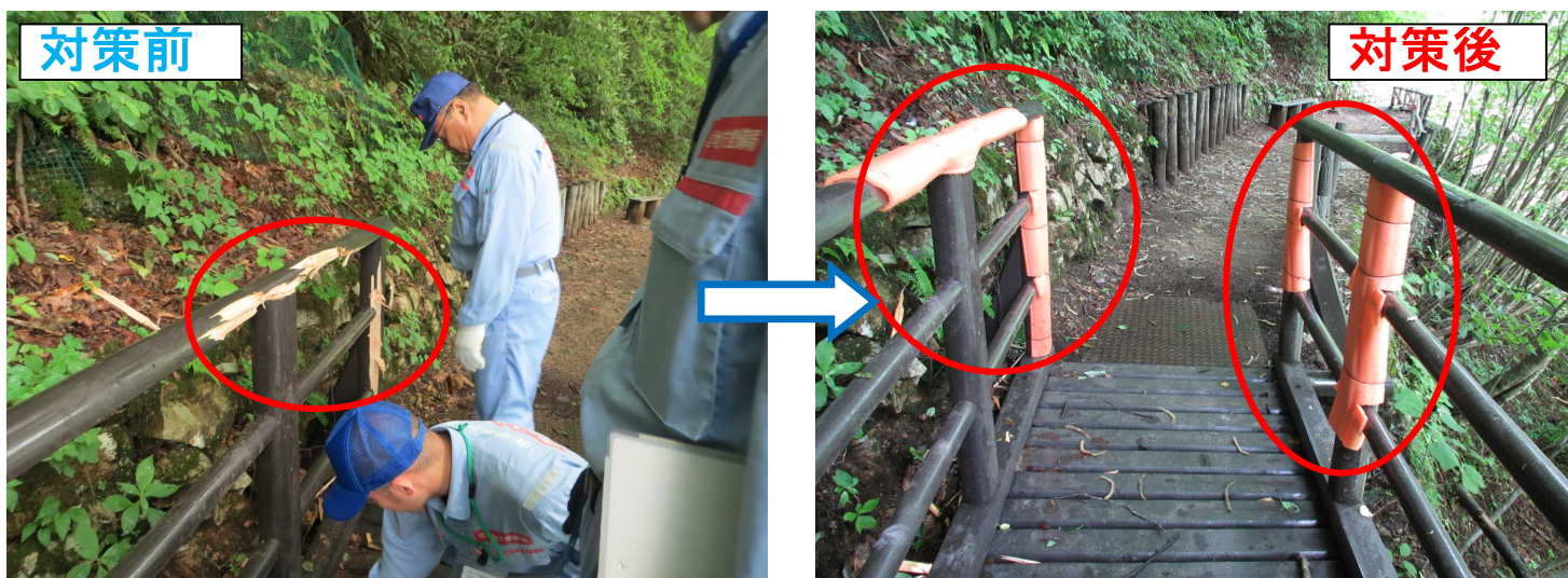
転落防止柵が破損