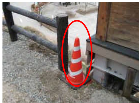
すき間にセーフティーコーンを設置