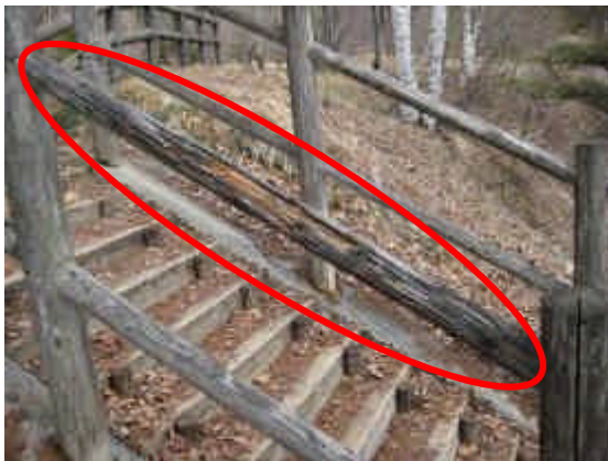
手摺りの一部が腐食