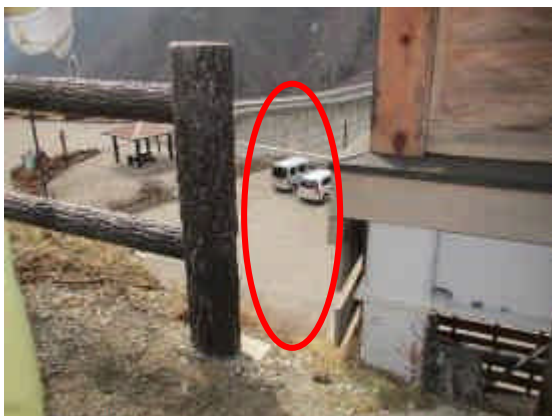
通路の転落防止柵にすき間あり