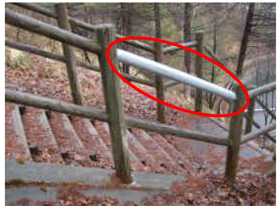
腐食部分をテープで補修