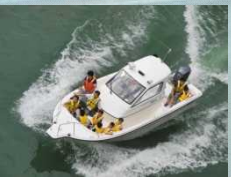
1回あたり約10分かかります