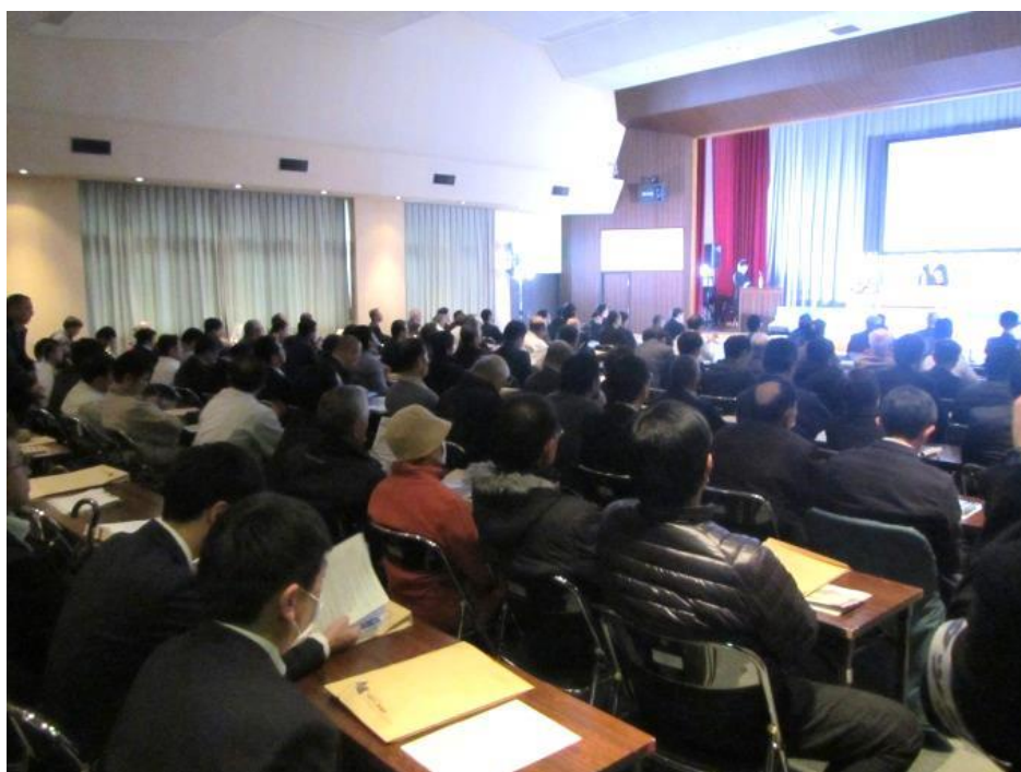
シンポジウム会場の様子