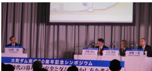
第1部「大町ダムと防災」の様子