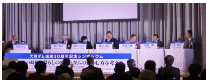
第2部「私たちのくらしと共創するダム」の様子