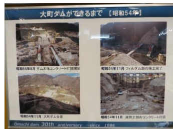
建設当時の写真パネル