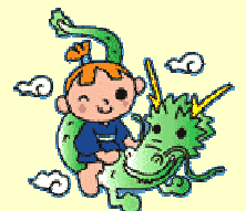
大町ダムキャラクター さいりゅうとこたろう