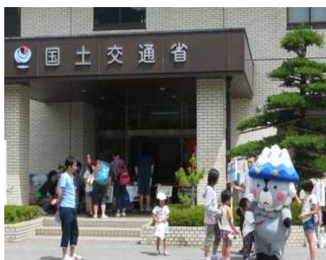
おおまぴょん登場！