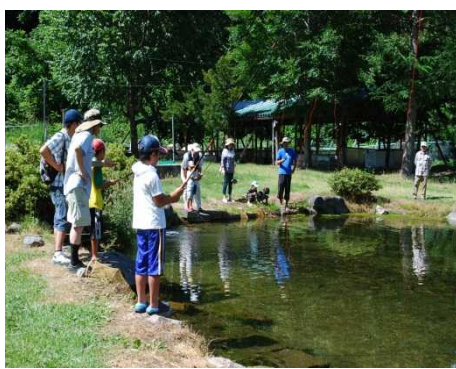
親子テンカラ釣り体験