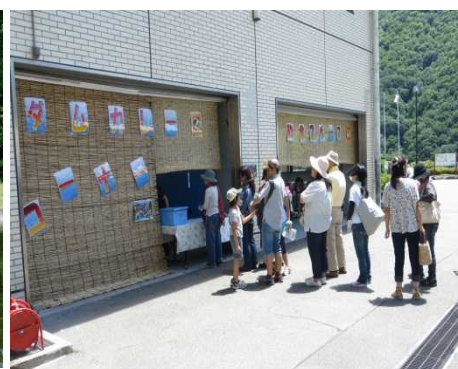
ダムカレーコーナー