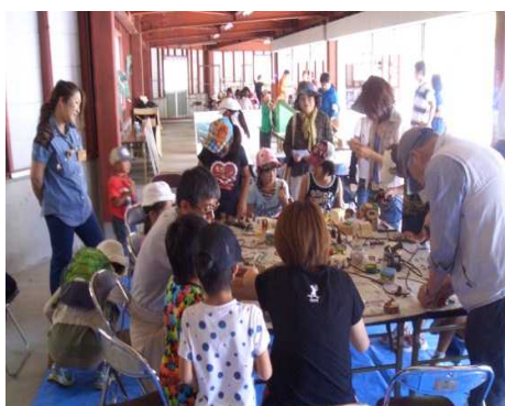
丸太切り体験・木工品作り