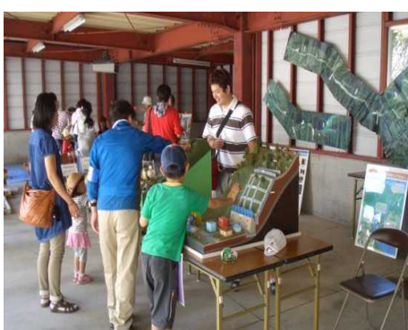
砂防事業パネル展示