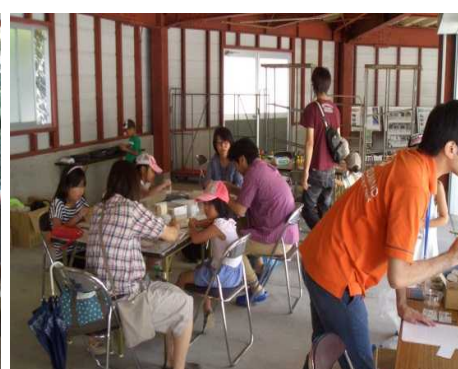
サンドアート作り・石器(ペンダント)作り