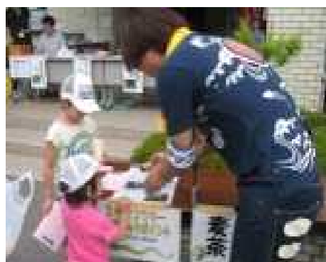
スタンプラリー・フラワーポット作り