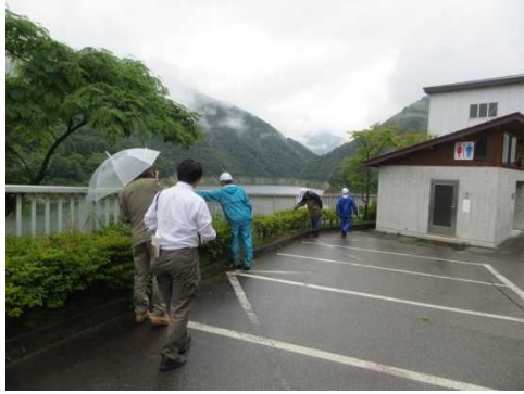
大町ダム管理所前