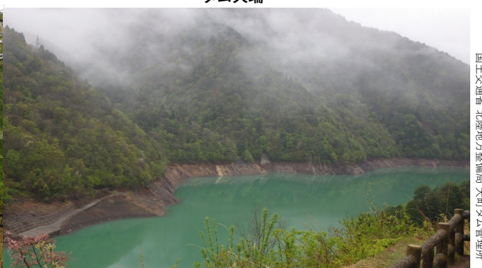
展望広場より龍神湖