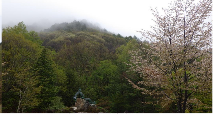
定点3 泉小太郎広場 (今週)