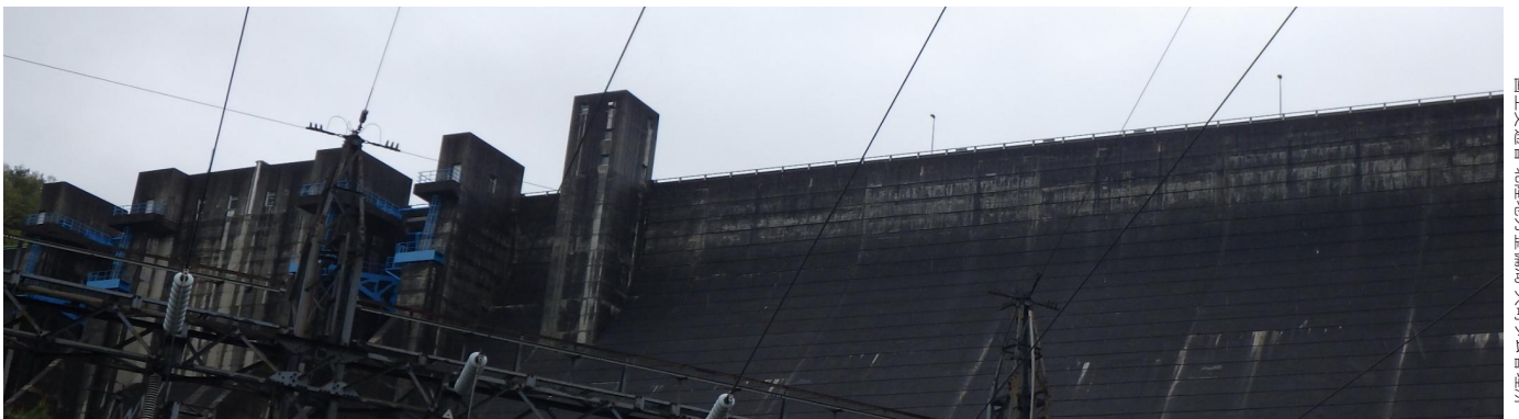
下流公園から大町ダム