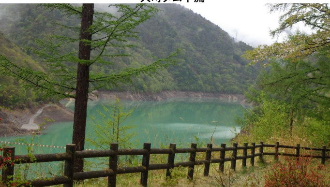
あずまやより龍神湖