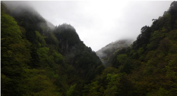
北葛沢(きたくずさわ) ①