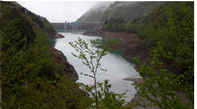
定点5 北葛沢覆道 (今週)