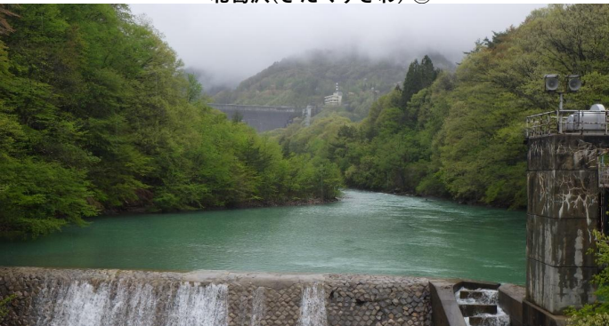
前越橋(まえこしばし)上流