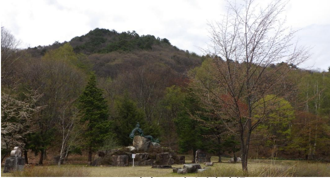
定点3 泉小太郎広場