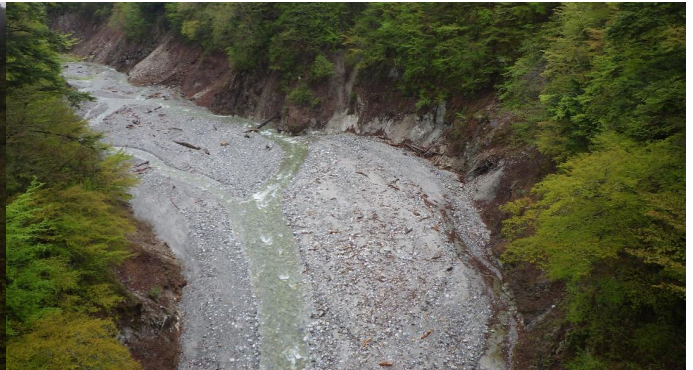
北葛沢(きたくずさわ) ②