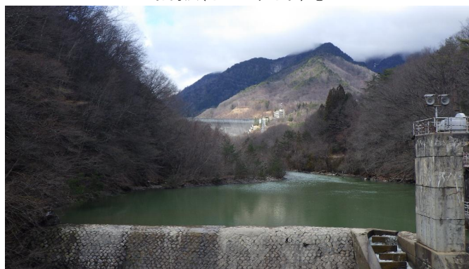
前越橋(まえこしばし)上流