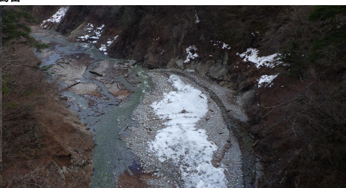
北葛沢(きたくずさわ) ②