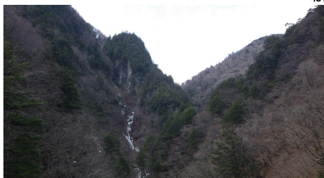
北葛沢(きたくずさわ) ①