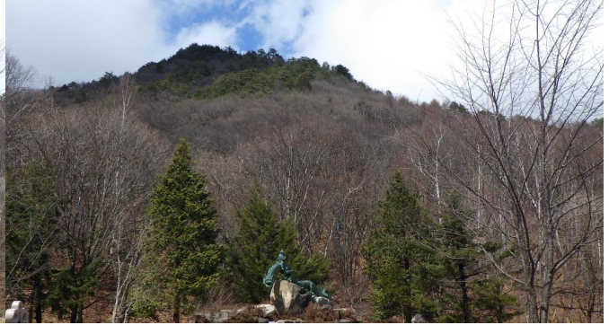
定点3 泉小太郎広場 (今週)