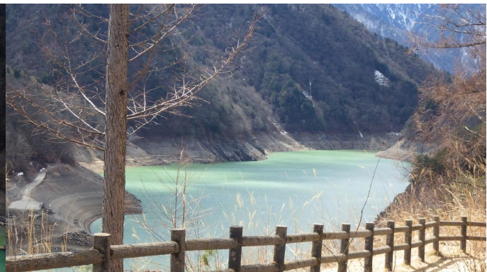
あずまより龍神湖