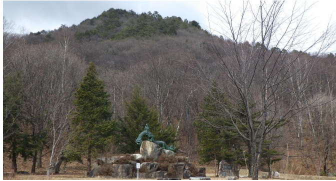
定点3 泉小太郎広場