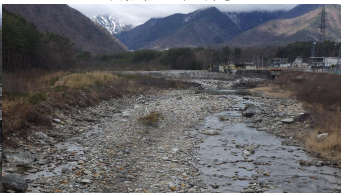
大出橋(おおいでばし)上流