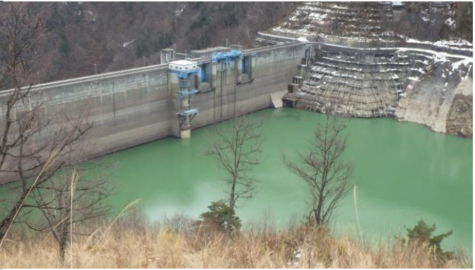
定点4 (今週) (今週)