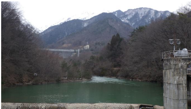
前越橋(まえこしばし)上流