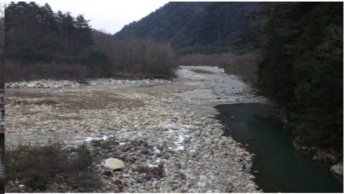
前越橋(まえこしばし)下流