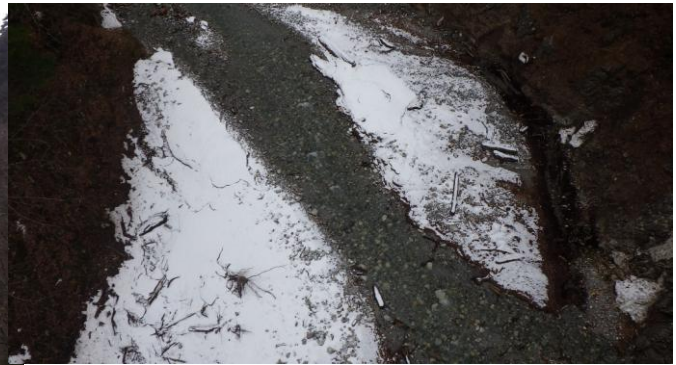
北葛沢(きたくずさわ) ②