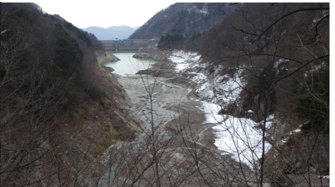
定点5 北葛沢覆道 (今週)