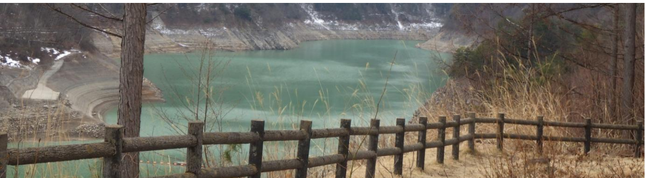
あずまやより龍神湖