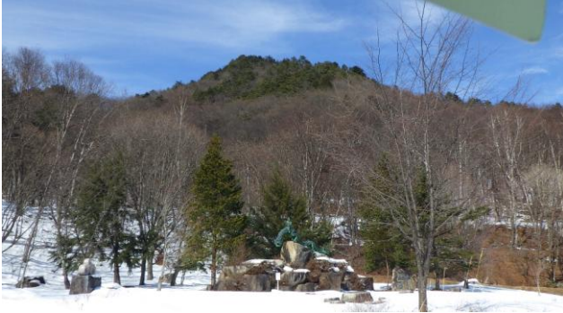
定点3 泉小太郎広場