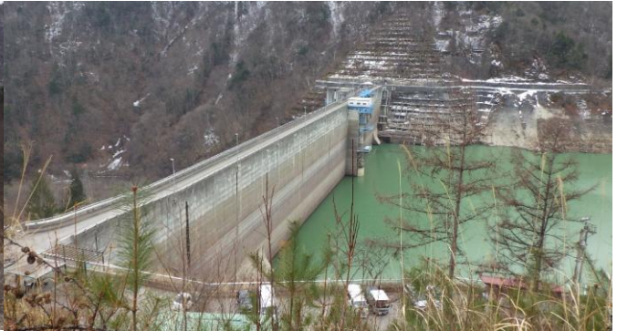
展望広場より龍神湖