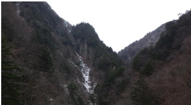
北葛沢(きたくずさわ) ①