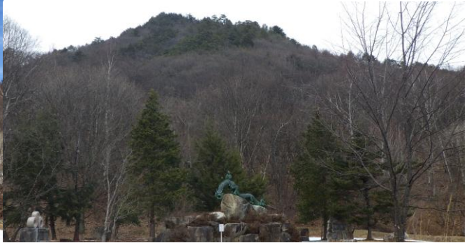
定点3 泉小太郎広場 (今週)