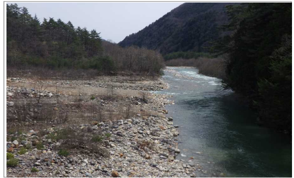
前越橋(まえこしばし)下流