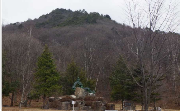
(先週) 定点3 泉小太郎広場