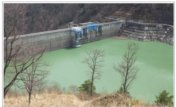
定点4 (今週) (今週)