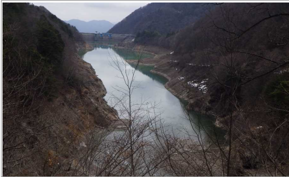
(先週) 定点5 北葛沢覆道