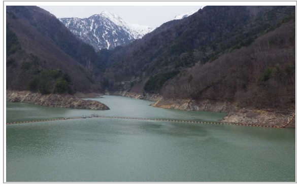
龍神湖(天端道路上)北葛沢