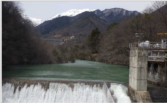
前越橋(まえこしばし)上流