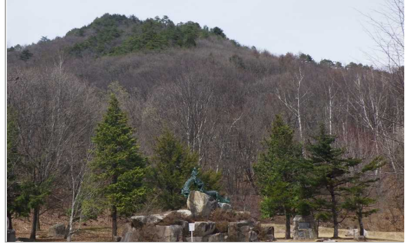
定点3 泉小太郎広場 (今週)