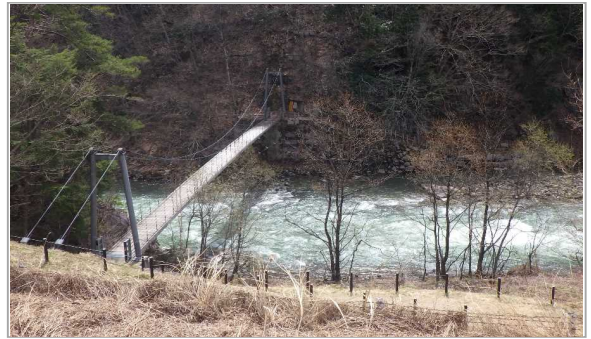
泉小太郎(いずみこたろう)吊り橋