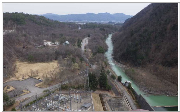
天端道路から大町市街