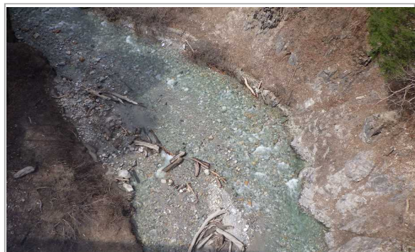
北葛沢(きたくずさわ) ②