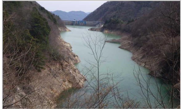
定点5 北葛沢覆道 (今週)