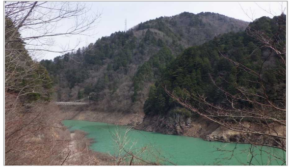
金沢広場の中ノ沢吊り橋 ①