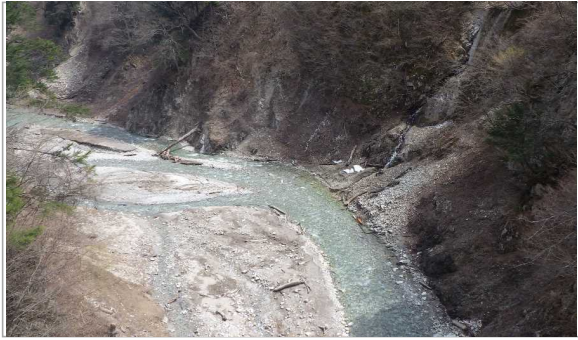
北葛沢(きたくずさわ) ③