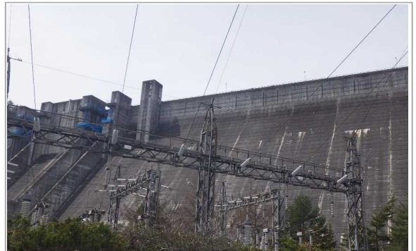
ダム下公園から大町ダム