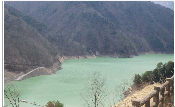
展望広場からの龍神湖