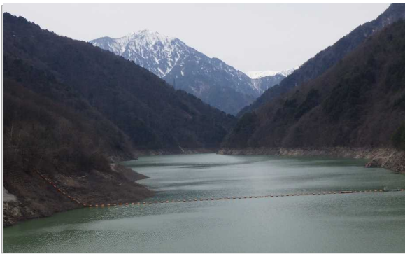
龍神湖(天端道路上)網場