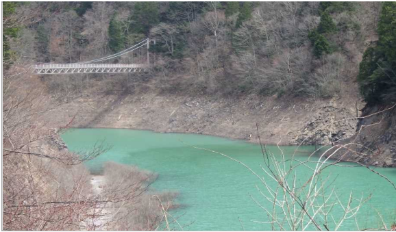
金沢広場の中ノ沢吊り橋 ②