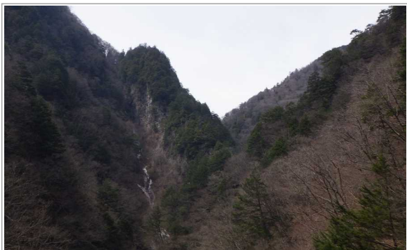
北葛沢(きたくずさわ) ①