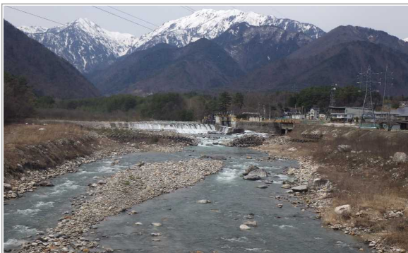
大出橋(おおいでばし)上流