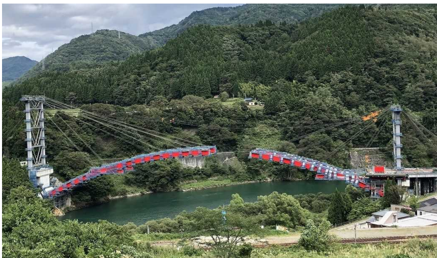
大規模橋梁の建設が進む猪谷榆原道路(富山市)