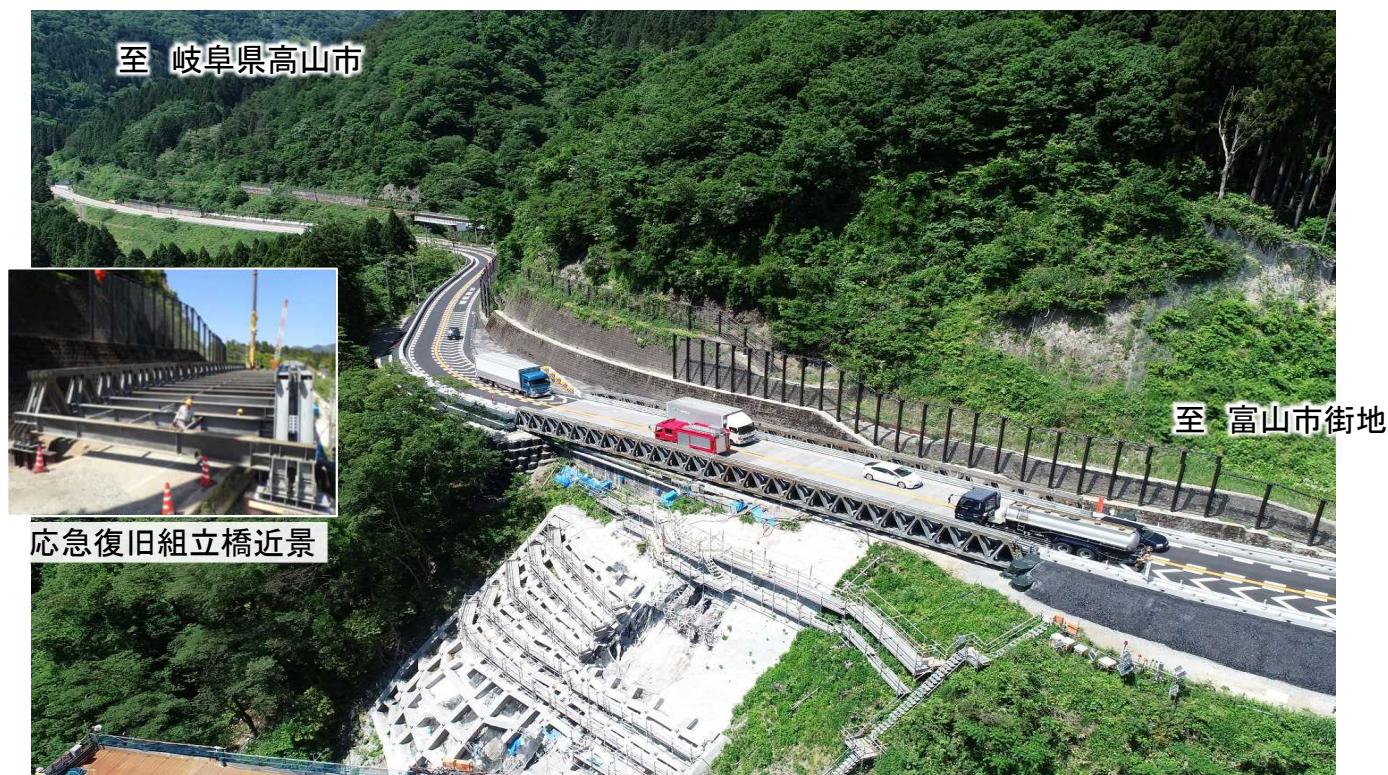
法面崩落箇所において、応急復旧組立橋により交通解放している国道41号(富山市)