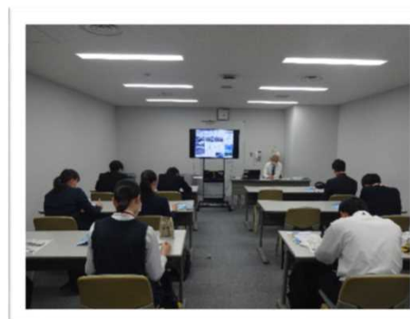
令和4年度 実施状況