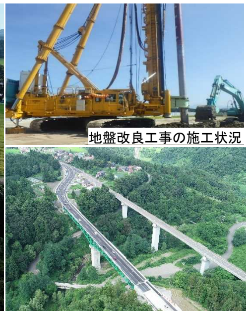
昨年度完成した、交通の安定化を図る妙高大橋（妙高市）