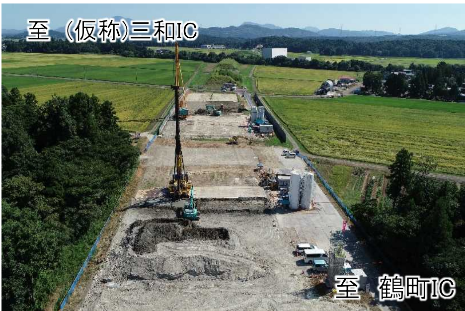
国と地域が連携し、ネットワーク整備を推進している大規模改築事業：上越三和道路（上越市）