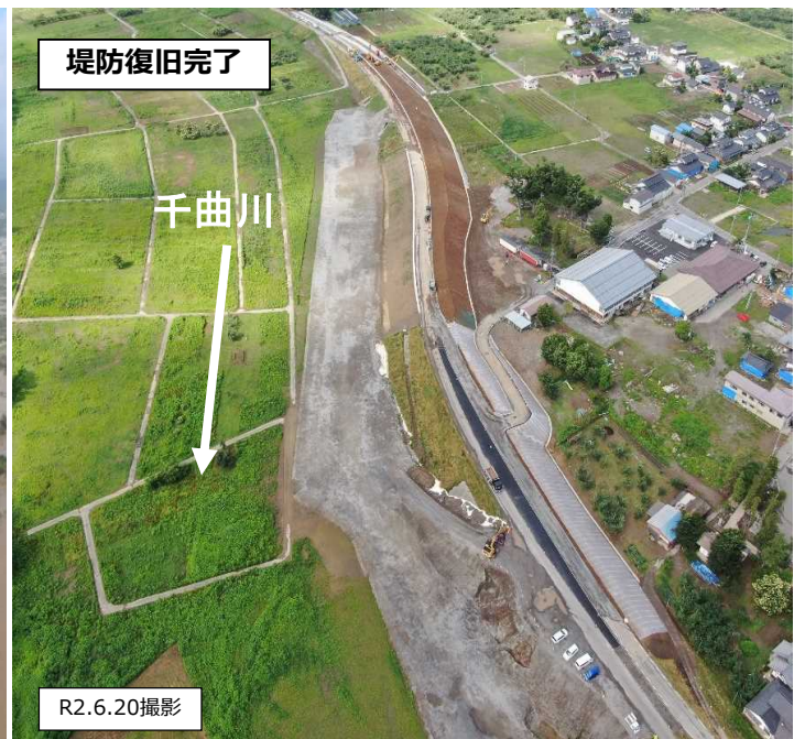
令和元年度災害で堤防決壊した箇所の復旧現場（長野市）