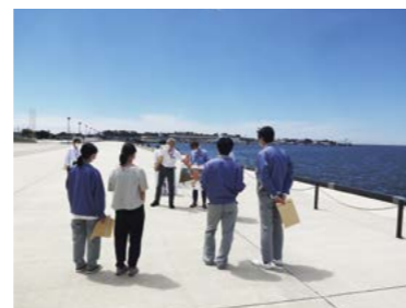
金沢港ターミナル