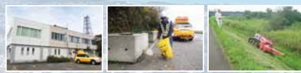
出張所 (直江津国道維持出張所) | 道路パトロール | 河川の除草

③ 出張所とは より地域に密着して社会資本整備や維持管理を行うため、73の出張所を各地域に配置しています。出張所には、パトロールや補修工事、許認可など維持管理を行う出張所や新たな社会資本整備のみ行う出張所があります。