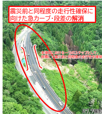
震災前と同程度の 走行性を確保