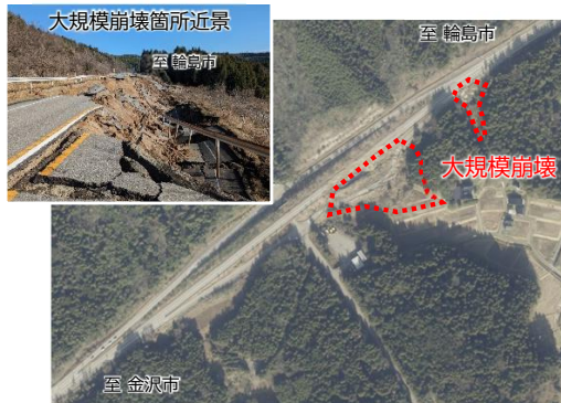
被災直後 (本線・金沢方面オフランプ大規模崩壊)