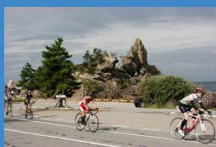
「ツール・ド・のと」の盛大な開催

「能登の里山里海を自転車で走るのは楽しい！」能登の魅力を体感できることを国内のみならず海外へ発信し、サイクルツーリズムを盛り上げます。