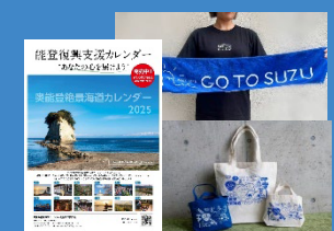
奥能登絶景海道の企画

奥能登の旅から人と風景をつなぐ風景街道。魅力あるいしかわの風景や震災遺構を活用した観光イベントの実施や美化活動など地域住民が参加するみちづくりを進めます。