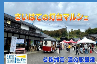
地域の個性を活かした環境整備

いまや旅の目的地から地域づくりの拠点へと進化する「道の駅」。観光拠点としての環境整備や地域の特産品の販売など、人の集う賑わいの場をつくります。