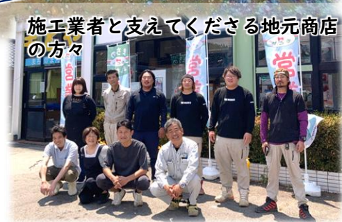
施工業者と支えてくださる地元商店 の方々