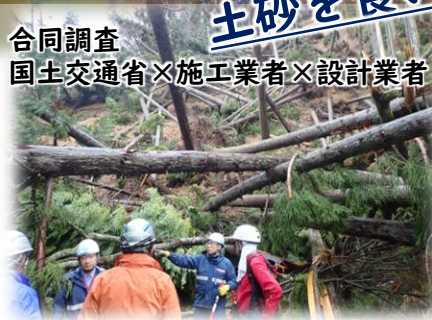
合同調査 国土交通省×施工業者×設計業者