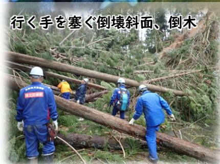
行く手を塞ぐ倒壊斜面、倒木