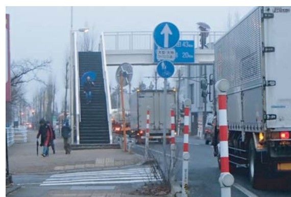
通学時間帯の通行状況