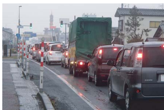
市街地の渋滞状況

白根バイパスは、これらの問題を緩和し、主要幹線道路としての機能充実を図り、他の都市計画道路と一体となった道路網を構成し、秩序ある都市の発展に寄与することを目的としています。