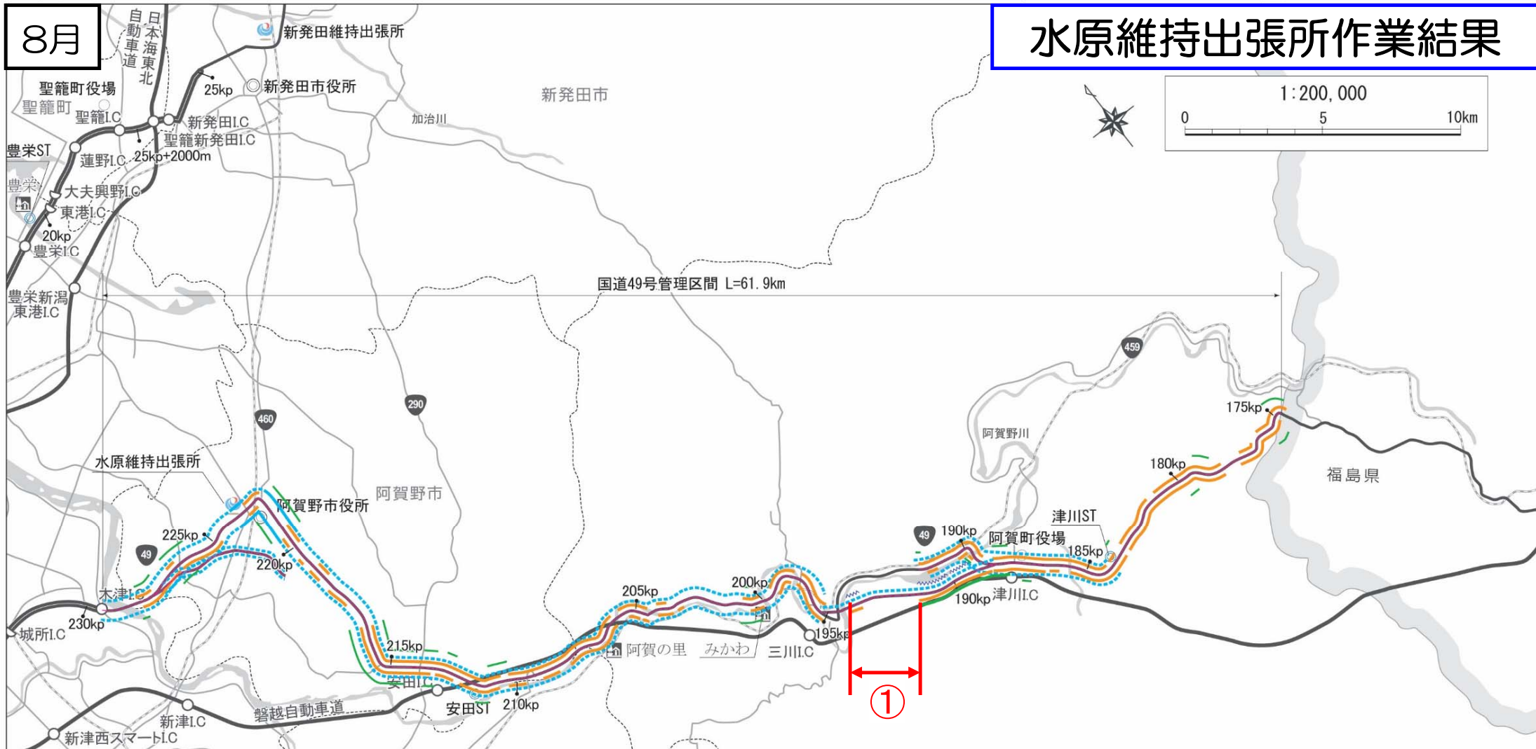
水原維持出張所管内 維持作業結果