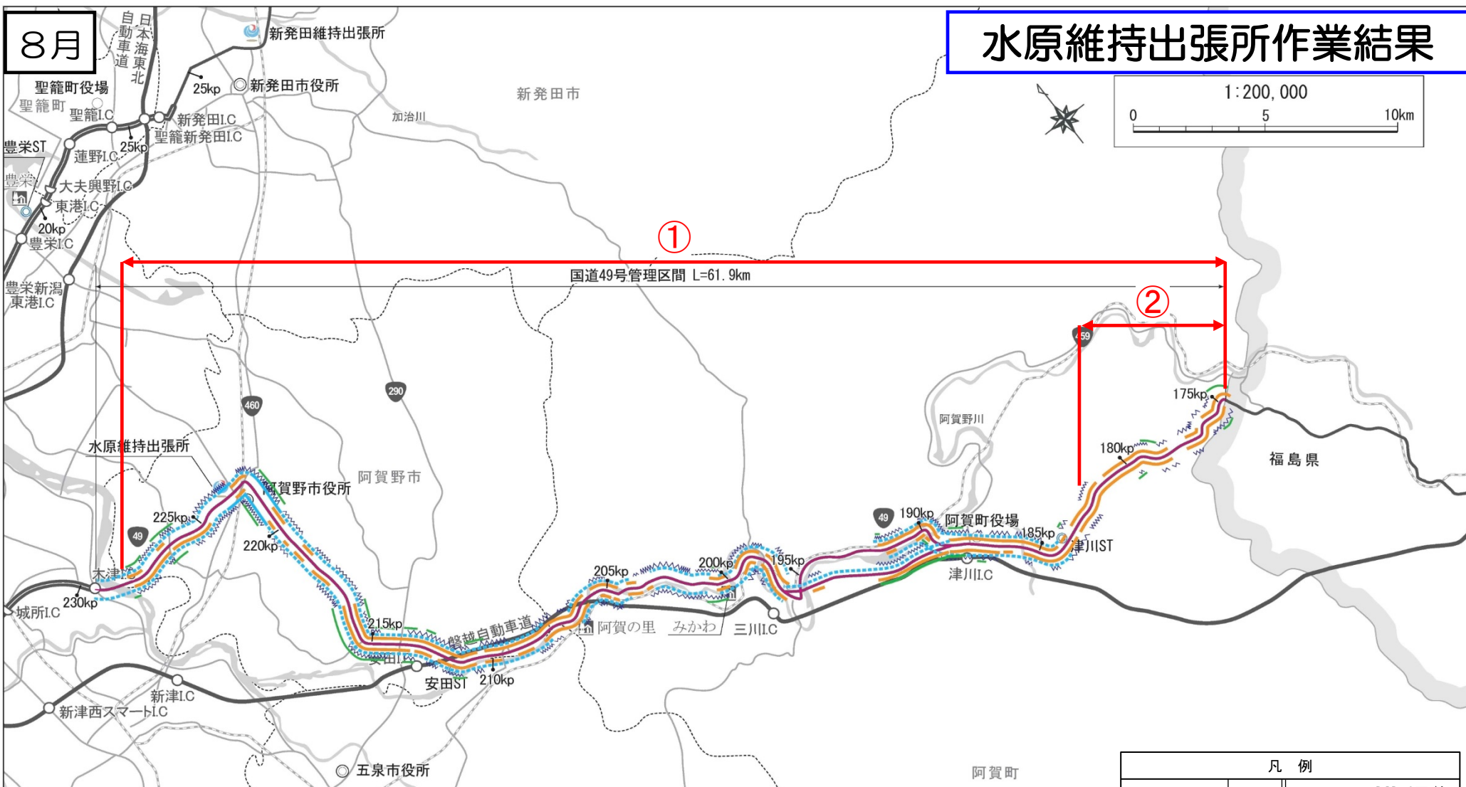
水原維持出張所管内 維持作業結果