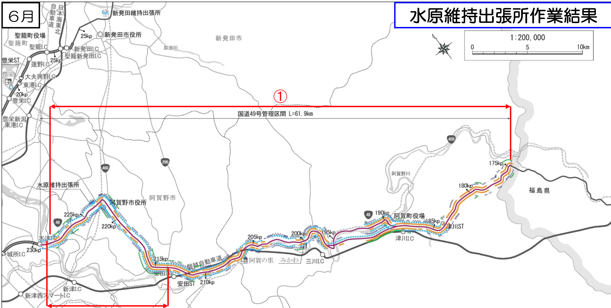
水原維持出張所管内 維持作業結果