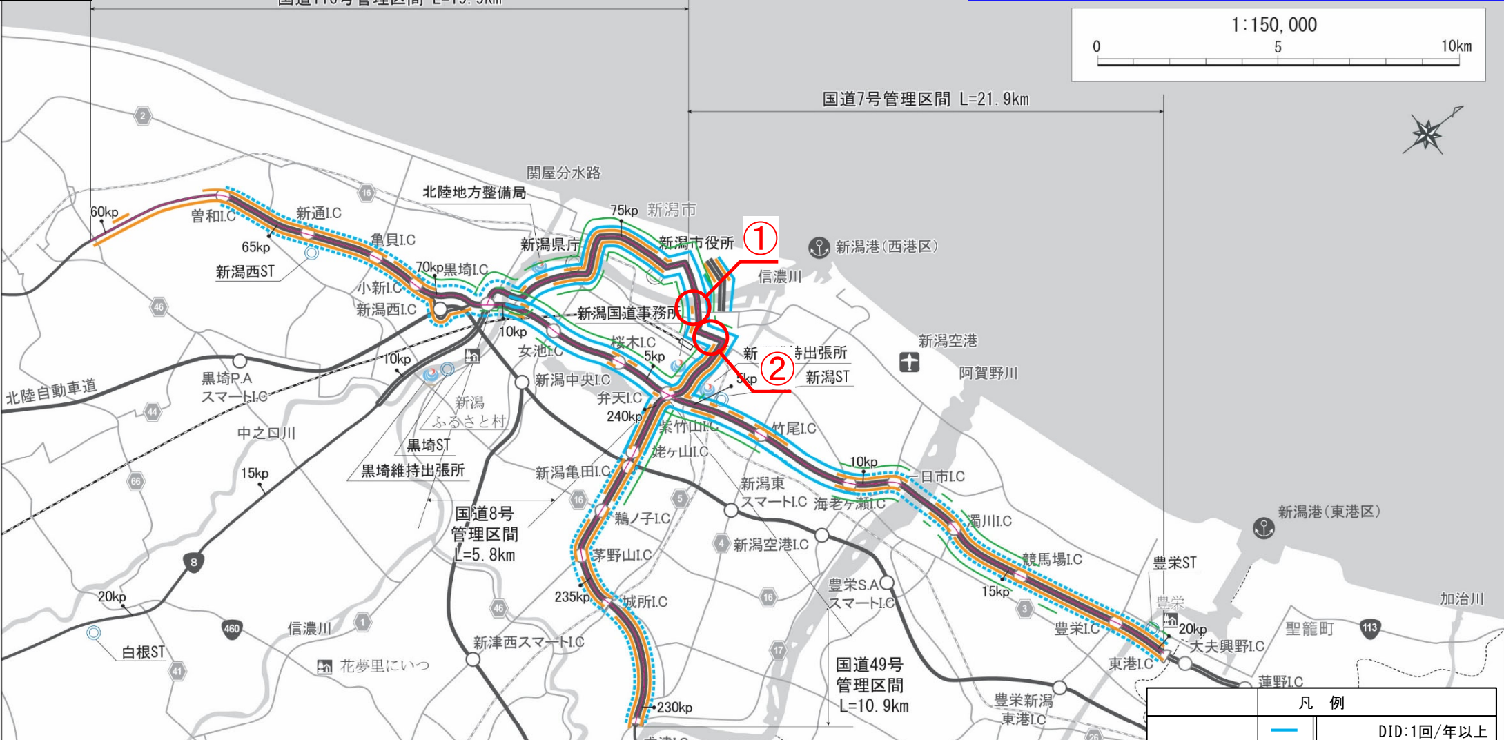
新潟維持出張所管内 維持作業結果 令和6年3月