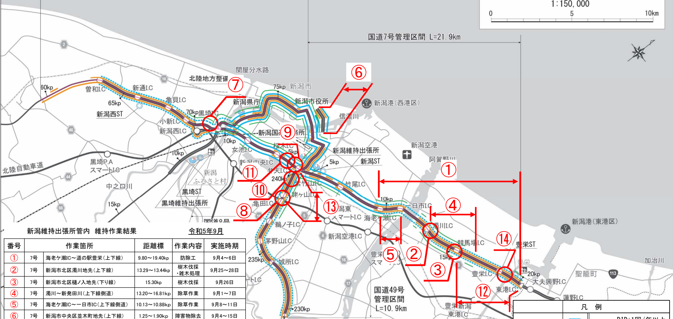
新潟維持出張所管内 維持作業結果