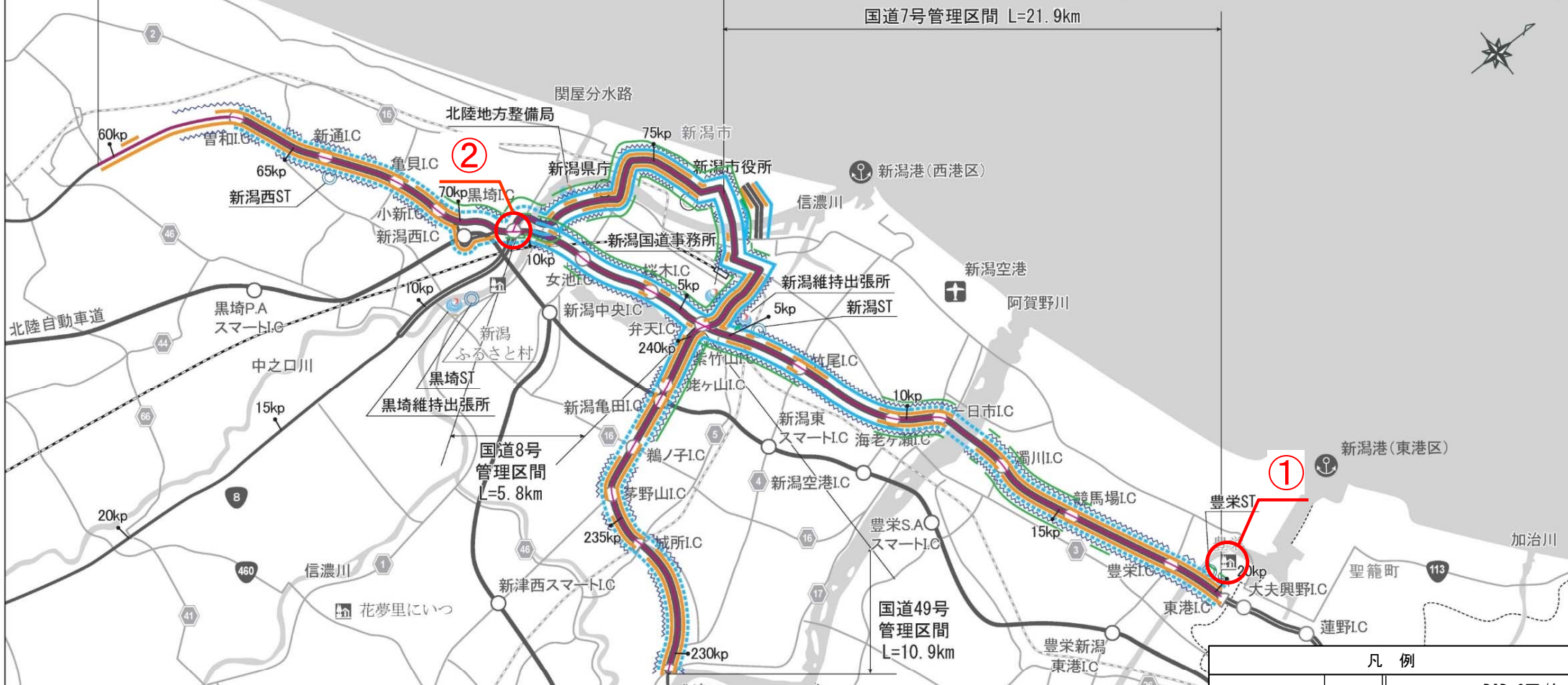
新潟維持出張所管内 維持作業結果