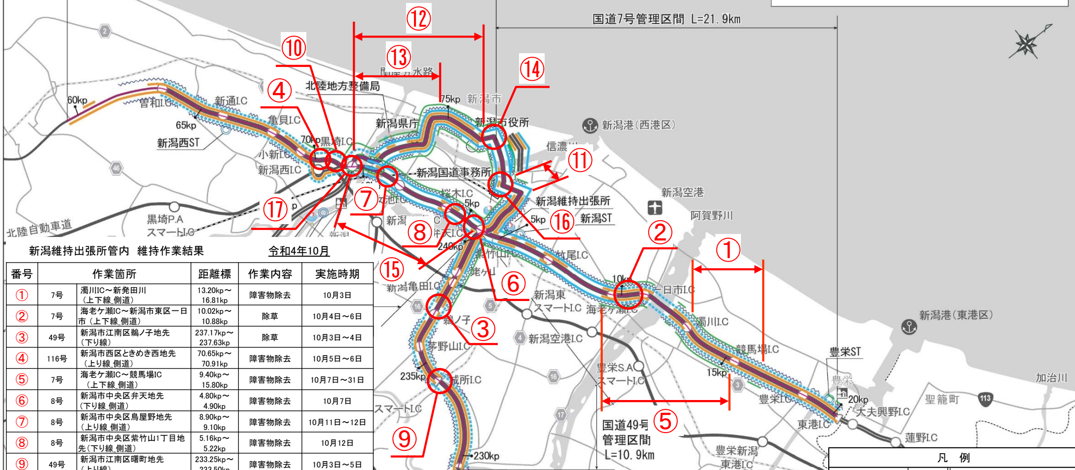
新潟維持出張所管内 維持作業結果