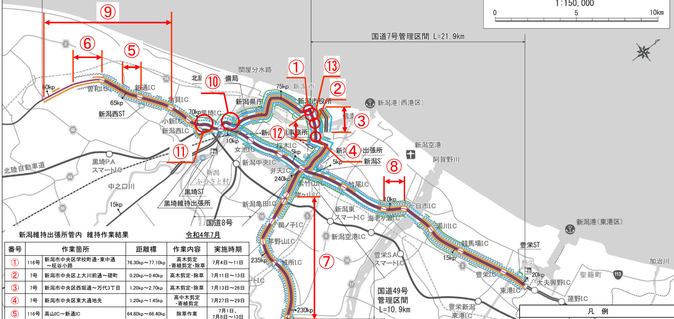
新潟維持出張所管内 維持作業結果