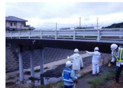
(現地点検の技術支援)