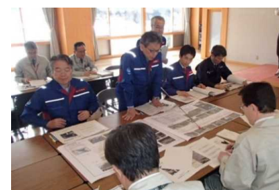
(直轄診断後自治体に説明する様子)