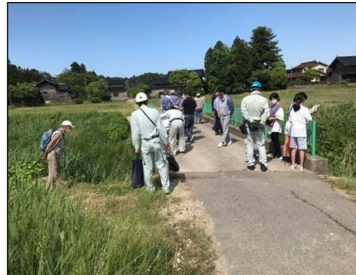
地域住民や学生が協力して点検を実施している様子