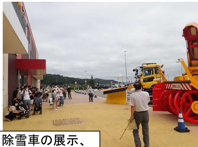
除雪車の展示、 除雪方法の説明