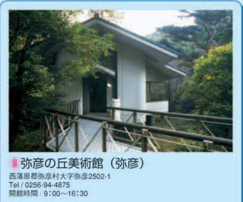
弥彦の丘美術館 (弥彦) 新潟県弥彦村大字弥彦2500-1 Tel: 0254-88-4879 観覧時間: 9:00~16:30