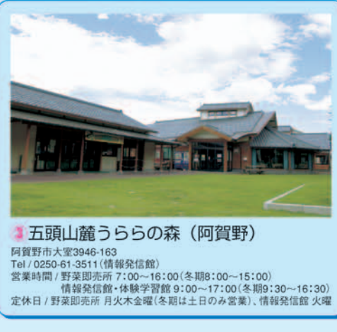
五頭山麓うらの森 (阿賀野) 阿賀野市大字3948-183 Tel: 0256-31-1111 (観光案内係) 営業時間: 野営場利用: 7:00~18:00 (冬期: 10:00~18:00) (冬期: 10:00~18:00) (冬期: 10:00~18:00) 定休日: 野営場利用: 月火水木金土曜日は土曜日のみ変更、休館日: 休館日