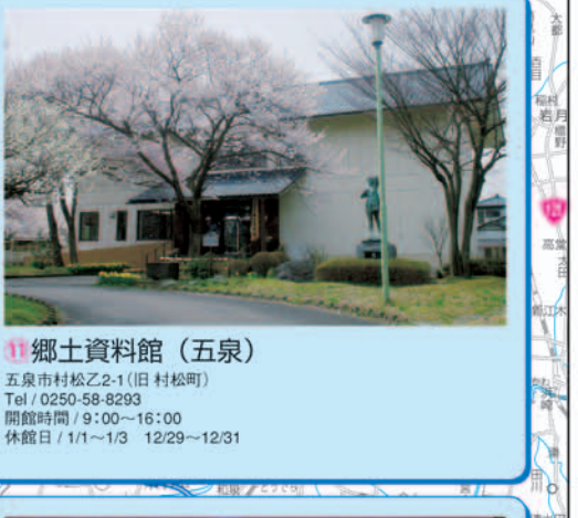
郷土資料館 (五泉) 五泉町郷土2-11 (旧 村松町) Tel: 0252-68-8202 観覧時間: 9:00~16:00 (休館日: 11月~12月: 12月29日~1月31日)