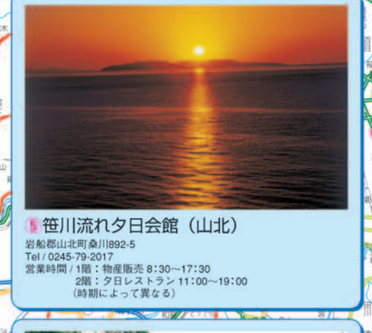
笹川流れ夕日会館 (山北) 山北町山北1000-5 Tel: 0254-79-2027 営業時間: 1階: 9:00~17:30 (2階: 9:00~18:00) (時期によって異なる)