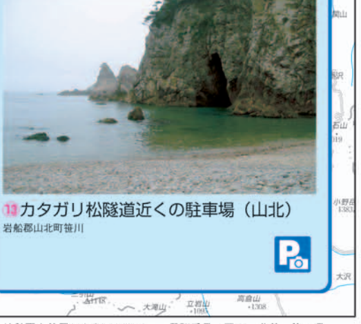
カタリ松尾道近くの駐車場 (山北) 山北町山北