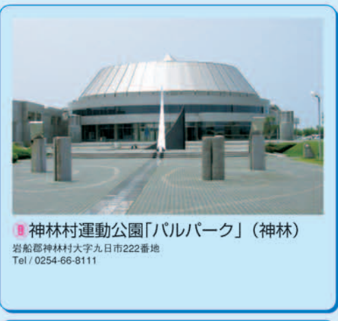
神林村運動公園「パルパーク」(神林) 新潟県神林村大字入江222番地 Tel: 0254-46-9111