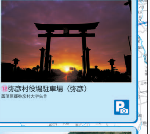
弥彦村役場駐車場 (弥彦) 新潟県弥彦村大字弥彦