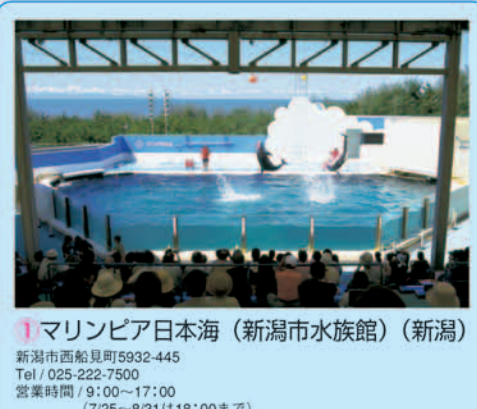
マリニア白海 (新潟水族館) (新潟) 新潟市東区長町2042-445 Tel: 025-222-7000 営業時間: 9:00~17:00 (10~3月: 9:00~17:00) (10~3月: 10:00~16:00)