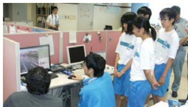
カメラを操作している様子

7月16日(水)、17日(木)の二日間、白根北中学校2年生5名が総合学習の一環として新潟国道事務所の黒埼維持出張所などで国道の管理について学びました。16日、生徒達は国道の管理などについて説明を受けた後、情報管理室を見学し、道路に設置されたカメラを実際に操作しました。生徒の一人は「たくさんカメラがあり、安全に通行するためにたくさんの方が関わっていることが分かった。」と感心していました。その後、今年度開通予定の白根バイパスの工事現場を見学しました。