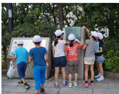
モニュメントの清掃