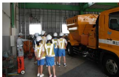
除雪車見学の様子

新潟国道事務所ではこれからも学校の総合学習などを支援していきますのでお気軽にお問い合わせください。